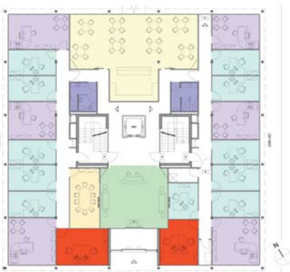
Plan du rez-de-chaussée

par un grand percement tridimensionnel dans le volume principal où une marquise en verre et métal, suspendue à la façade par des tirants en inox accentue la force de cette majestueuse entrée. Un jeu de spots sur et sous les sommiers du rez-de-chaussée contribue à l'animation et à la mise en valeur de la façade en marquant, pendant la nuit, les volumes et les profondeurs subtiles du bâtiment. Tous les matériaux utilisés sont de qualités supérieures. La serrurerie extérieure est en acier thermolaqué, le revêtement extérieur est en granit, la ferblanterie en inox et les doubles vitrages sont munis d'un film légèrement miroité diminuant la transmission thermique. L'accès au bâtiment est contrôlé par vidéo surveillance et ne peut se faire qu'à travers un système de badge (clef électronique). Toutes les entrées et sorties sont enregistrées. Par ailleurs, une clôture sécurise le site où les accès par les portails sont filtrés une nouvelle fois par lecteurs de badges.